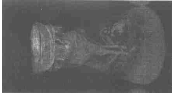
图2 药剂使被病毒感染的带壁烟草 细胞分化为再生植株